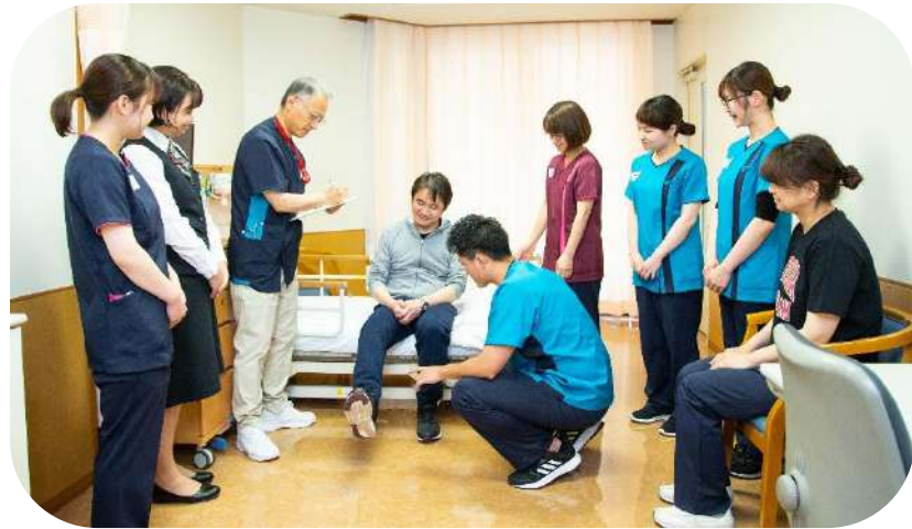
多職種による入院時の合同面接の場面