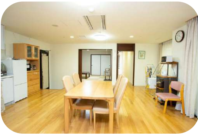
日常生活動作訓練室