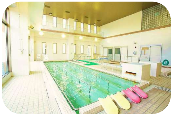
温泉水リハビリプール