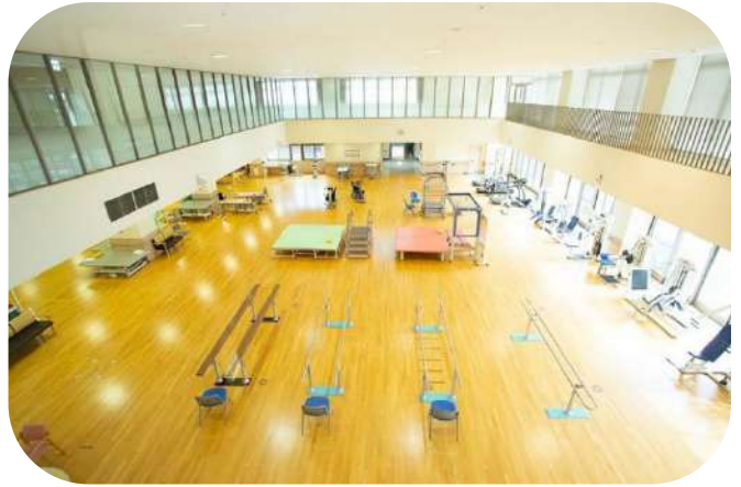
リハビリテーション室