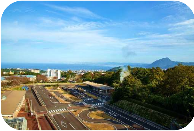
自動車運転コース