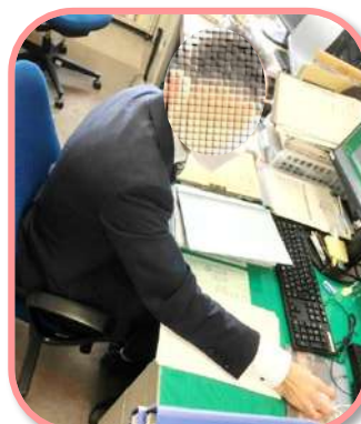
Aさんの職場での様子