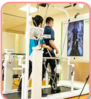
ウエルウォークでの 歩行訓練風景(病院)